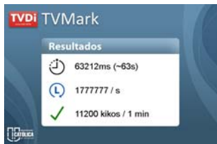
Figura 2: Tela de resultados após medição de benchmark

Criou-se dois modelos de benchmarking , pois o modelo com comparação de tempo necessita acessar o relógio do sistema, ou seja, exige aguardar uma interrupção de I/O no sistema. Com a adição do acesso ao I/O, criou-se a oportunidade de outro teste, além do processamento.