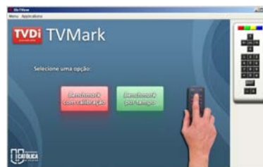
Figura 1: Interface da ferramenta de emulação XletView

Utilizou-se para emular um sistema embarcado, utilizou-se a ferramenta XletView para execução do software . Na Figura 1, demonstra-se a interface da ferramenta.